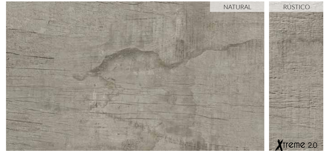
20 x 120 (8" x 48") _____ Natural B-74 30 x 120 (12" x 48") ESP 20 _____ Rústico B-113