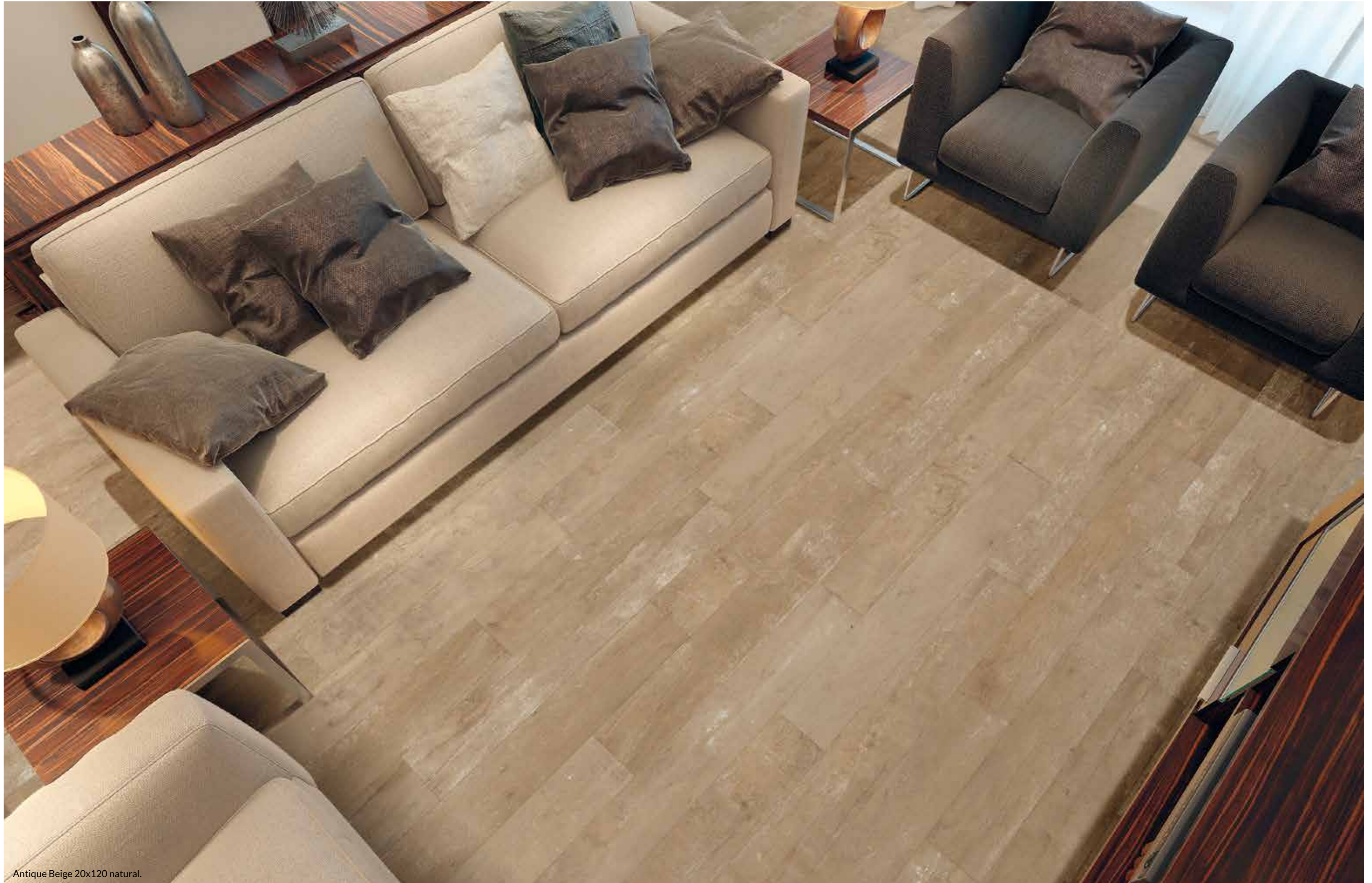
Antique Beige 20x120 natural.

PORCELÁNICO · PORCELAIN TILE · GRÉS CÉRAME · FEINSTEINZEUG