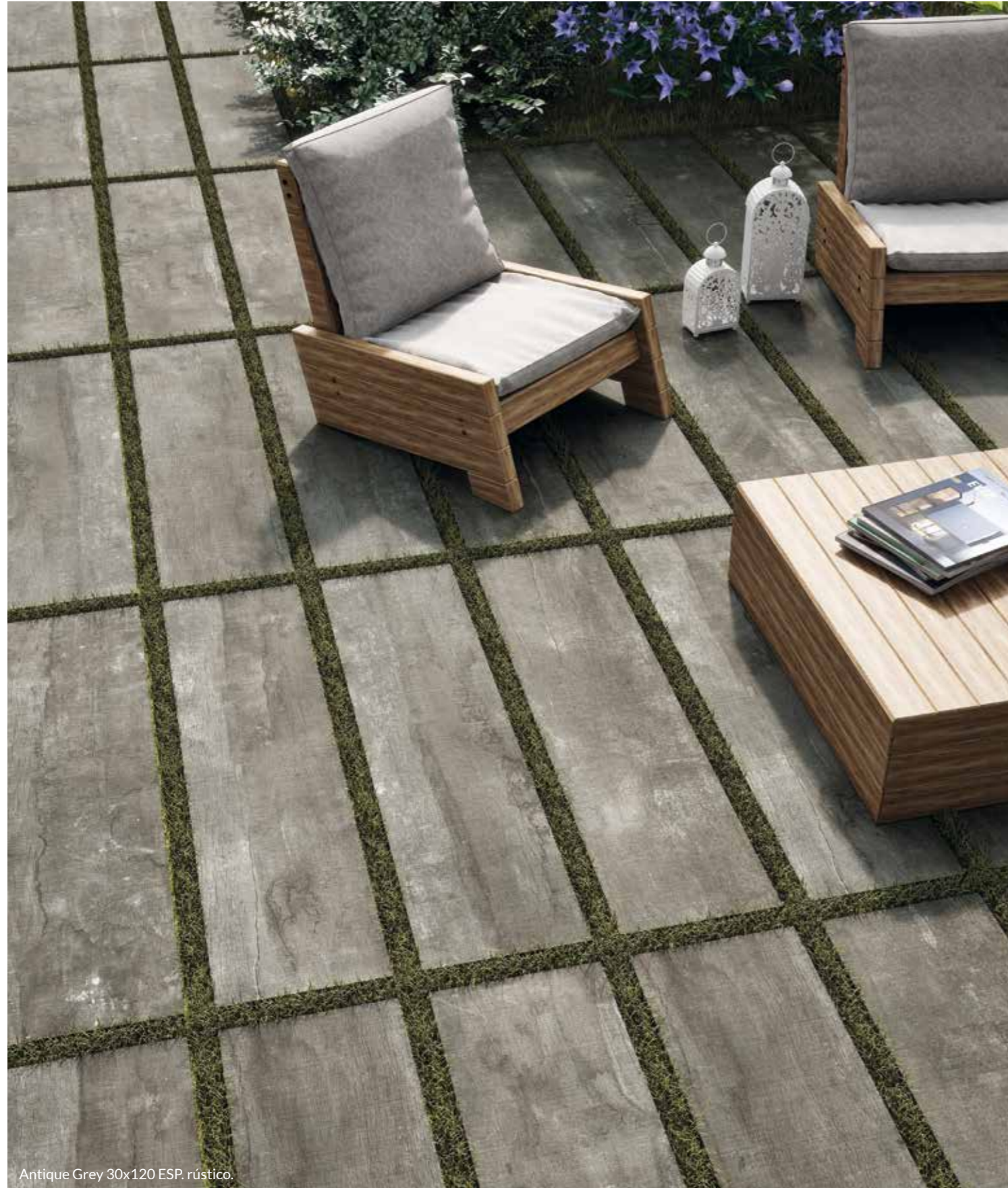
Antique Grey 30x120 ESP. rústico.