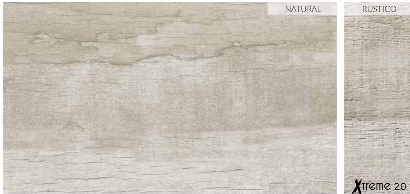
20 x 120 (8" x 48") _____ Natural B-74 30 x 120 (12" x 48") ESP 20 _____ Rústico B-113