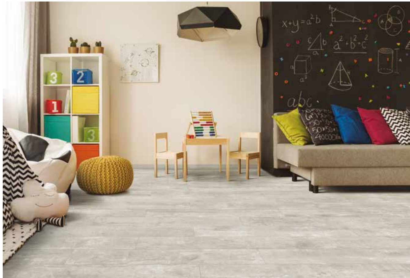
▼ Antique White 20x120 natural.