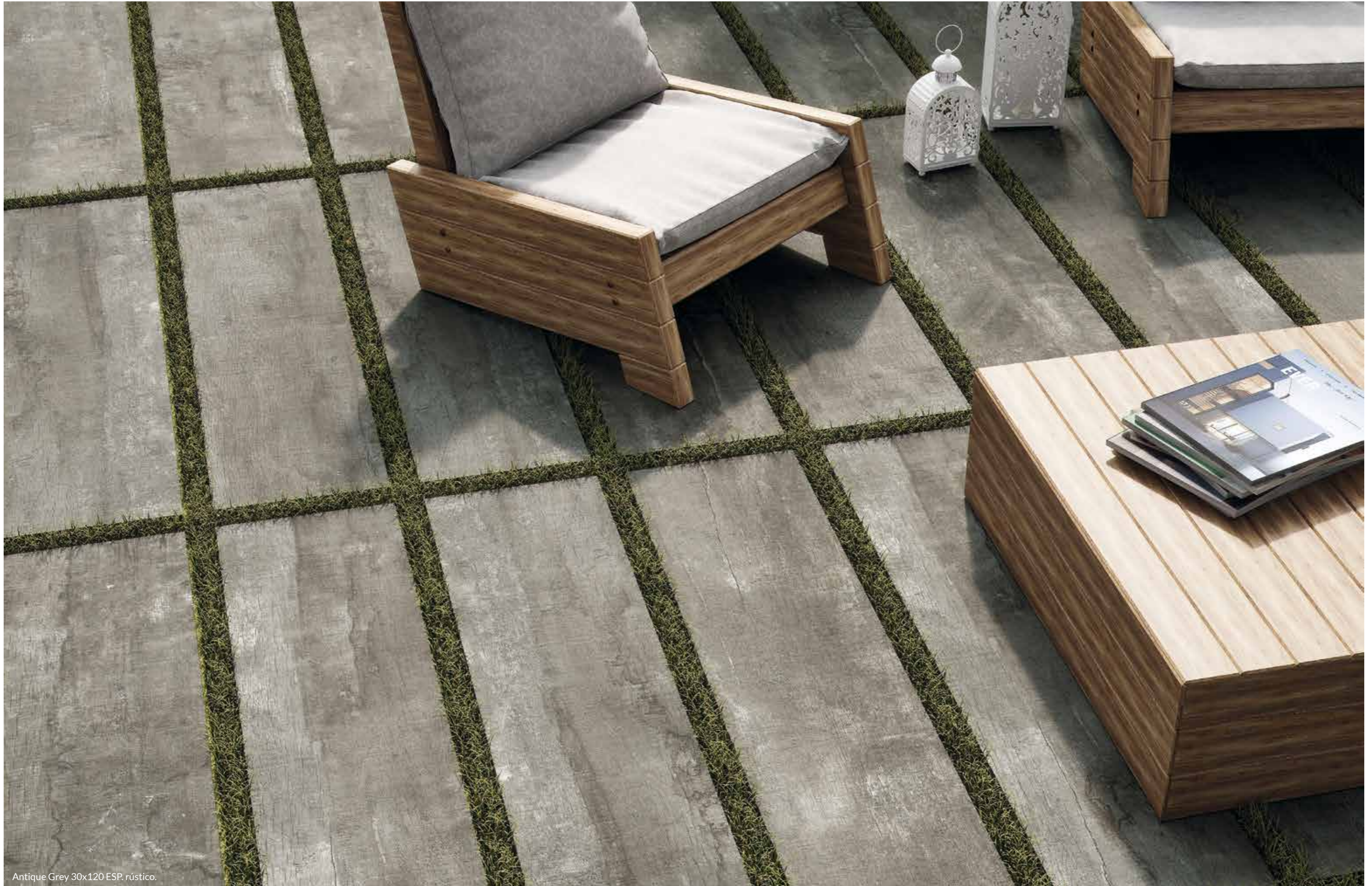
Antique Grey 30x120 ESP. rústico.

PORCELÁNICO · PORCELAIN TILE · GRÉS CÉRAME · FEINSTEINZEUG