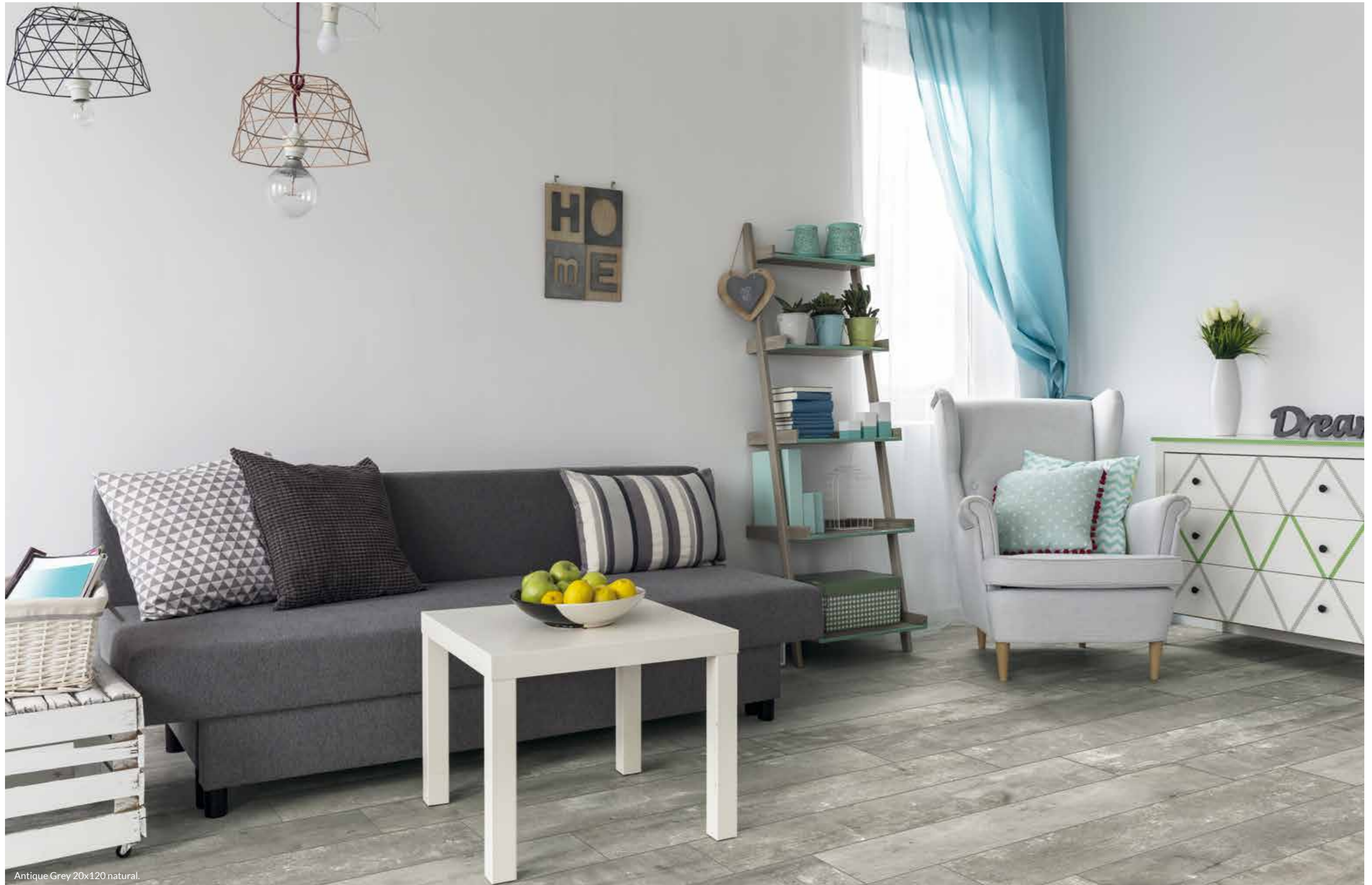
Antique Grey 20x120 natural.

PORCELÁNICO · PORCELAIN TILE · GRÉS CÉRAMÉ · FEINSTEINZEUG