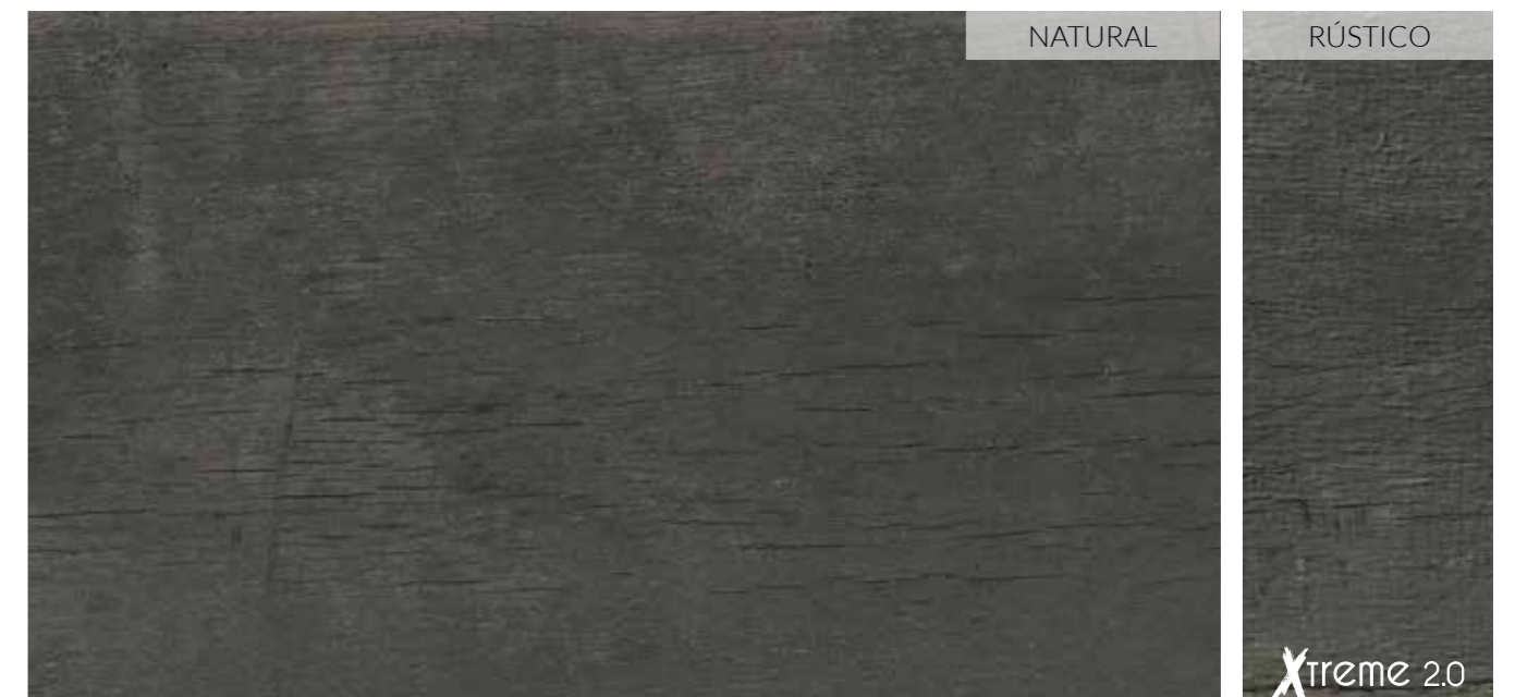
20 x 120 (8" x 48") _____ Natural B-74 30 x 120 (12" x 48") ESP 20 _____ Rústico B-113