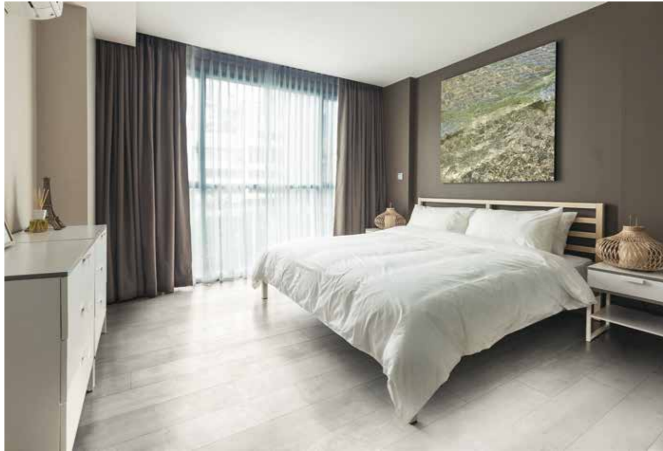
▲ Antique White 20x120 natural.

PORCELÁNICO · PORCELAIN TILE · GRÉS CÉRAME · FEINSTEINZEUG