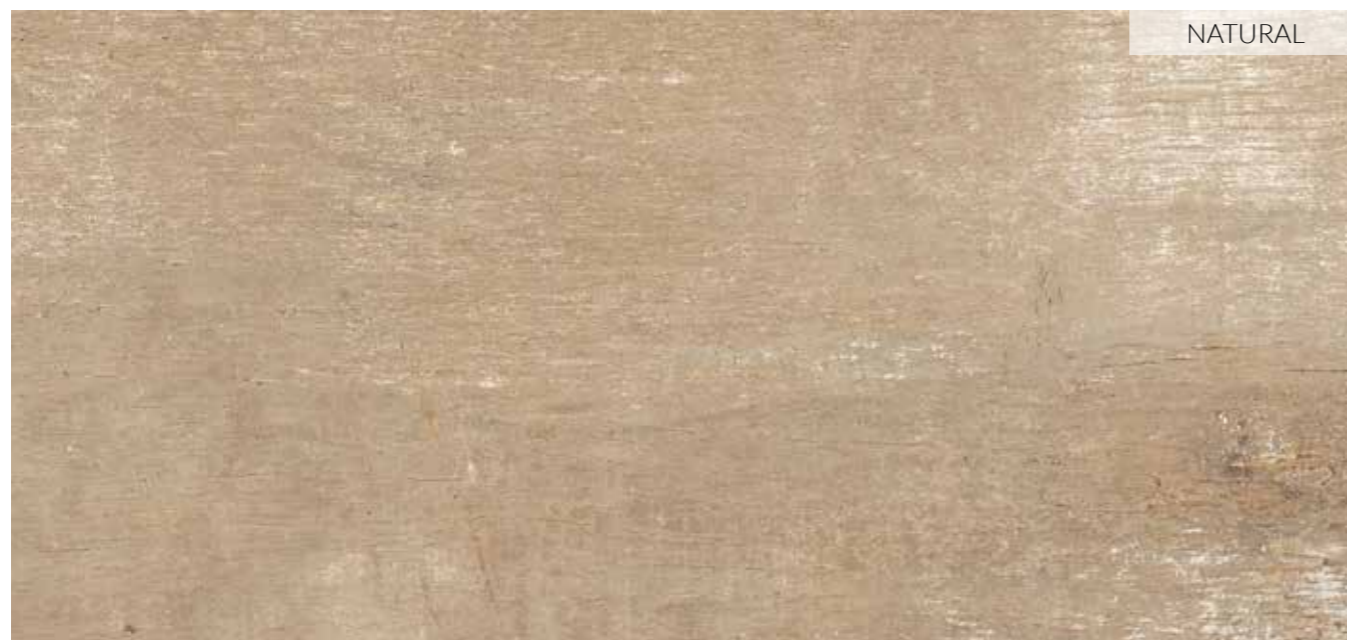
20 x 120 (8" x 48") _____ Natural B-74